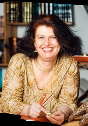
Claudia Ott

Alle Literatur- und Spracheninteressierte sind herzlich eingeladen.